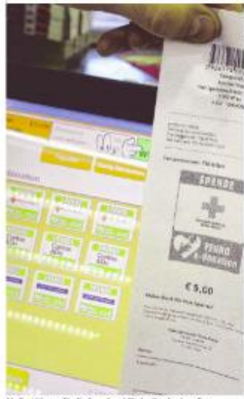
Als Bestätigung für die Spende erhält der Kunde einen Bon

Bloß die steuerliche Absetzbarkeit gestalte sich noch ein wenig kompliziert: Dafür muss man derzeit noch um eine Bestätigung bei der jeweiligen Organisation ansuchen – der Bon alleine reicht nicht. Dies wolle man aber ändern, betont Auer.